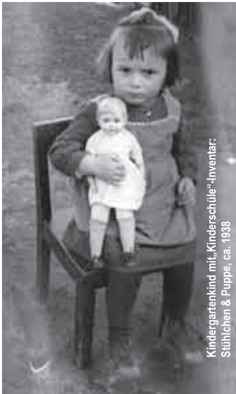
Kindergartenkind mit „Kinderschule“-Inventar: Stühli und Puppe, ca. 1938