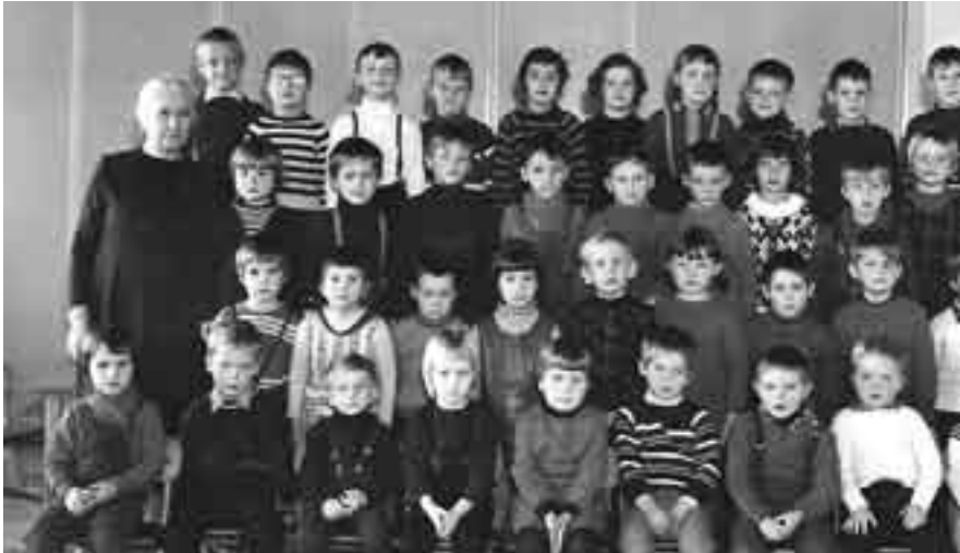
Gruppenbild aus dem Jahr 1970