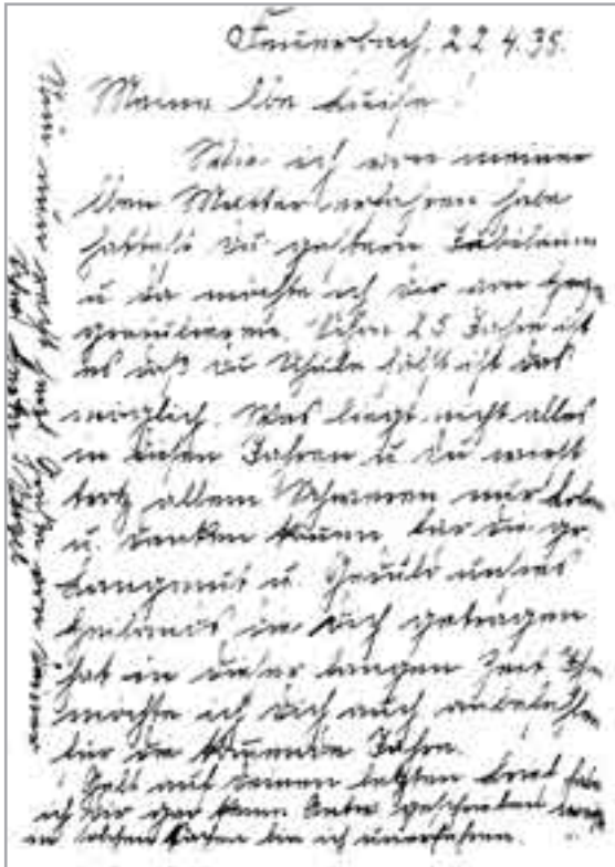
Postkarte an Tante Luise (Ebinger) zu Ihrem 25-jährigen Kindergartenjubiläum (Rückseite)

Kurz vor den Feierlichkeiten zum 100-jährigen Jubiläum musste der Kindergarten, den zu der Zeit nur noch rund 20 Kinder besuchten, am 1. November 1949 aufgrund der „Invalidierung“ von Luise Ebinger und „weil die ev. Kirchengemeinde die finanzielle Last nicht mehr tragen konnte“ geschlossen werden – ein Zustand, der über zwei Jahre anhielt. In der Zeit nutzte die Volksschule an 2 ½ Tagen