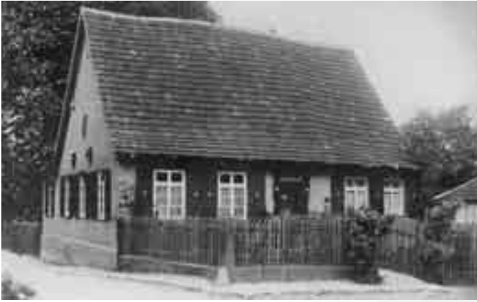
alter Kindergarten Kleinaspach