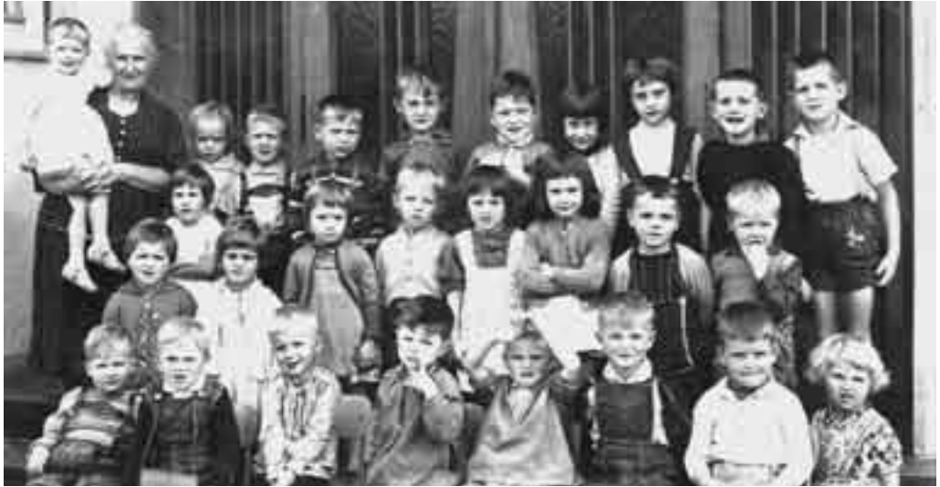
Gruppenbild von 1965

kommen durch „Reinigung, Heizung und Ordnungsdienst im Gemeindehaus“ aufbessern.