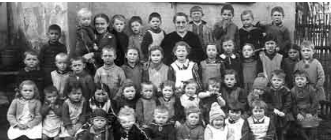
Gruppenbild von 1934