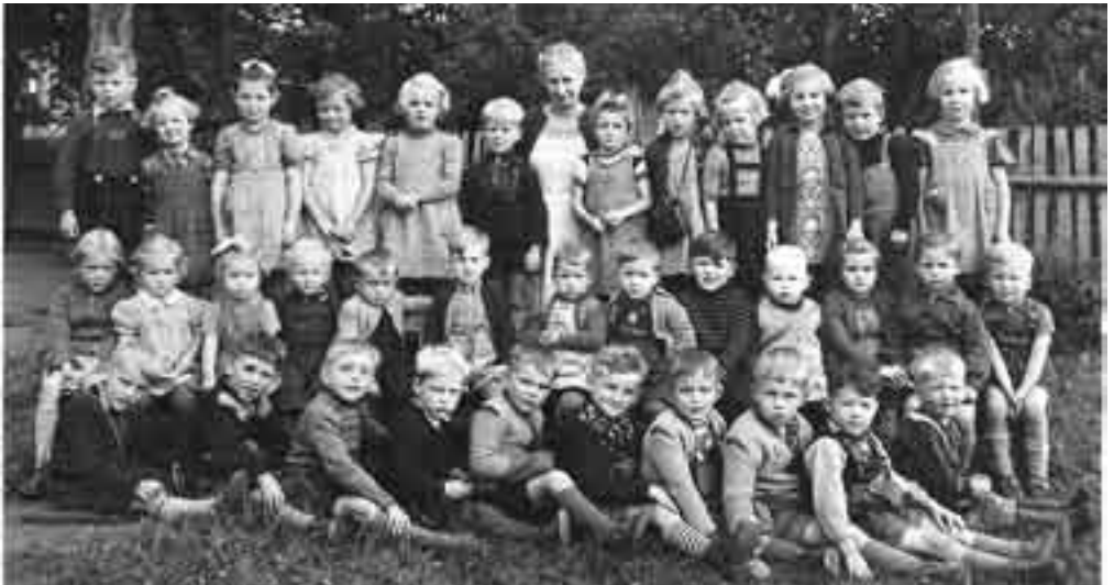
Gruppenbild von 1955

Der Oberkirchenrat hatte schon im Sommer 1951 in einem Rundbrief an alle Kirchengel-