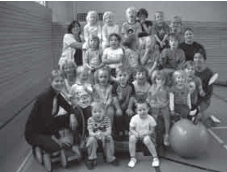
sportliche Kinder: Turnen in der Halle

und Erziehung für Kindergärten“ entstanden. Er beinhaltet Grundlagen und Zielen der Bildungsarbeit, pädagogische Herausforderungen, sowie Qualitätsentwicklung und Sicherung. Ein gravierender Schwerpunkt, vor allem für die praktische Arbeit, liegt auf den Bildungs- und Entwicklungsfeldern Körper, Sinne, Sprache, Denken, Gefühl/ Mitgefühl, Sinn/ Werte/ Religion.