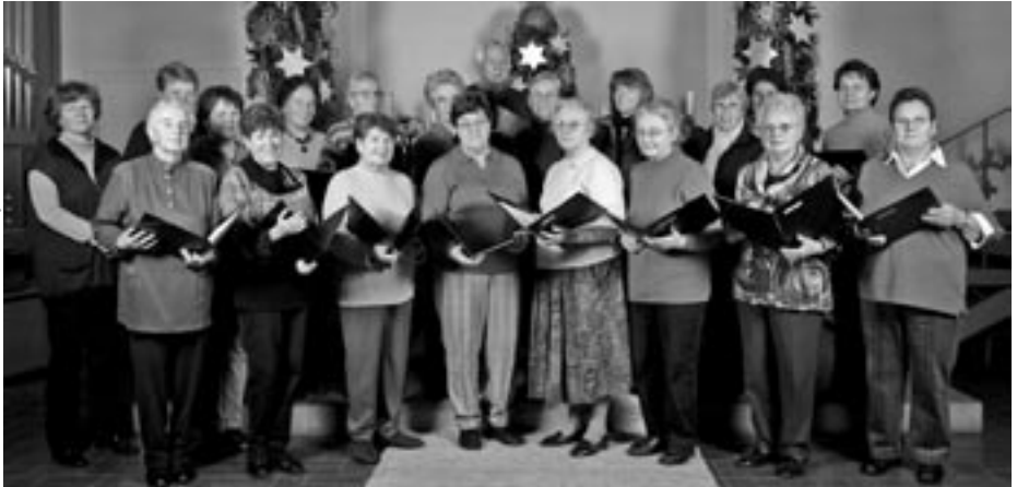
Foto: Andrea Seitz (12/ 2006) - wir bedanken uns herzlich für die Genehmigung zum Nachdruck des Bildes

Gern denken wir an die schönen festlichen Gottesdienste und Konzerte zurück, die Kirchenchor und Posaunenchor gemeinsam gestaltet haben. Nach jedem dieser großen Ereignisse konnten wir stolz und froh sagen, dass sich die intensive Vorbereitung in den