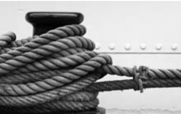
© Gemeindebrief - Magazin für Öffentlichkeitsarbeit; Foto: Wodicka