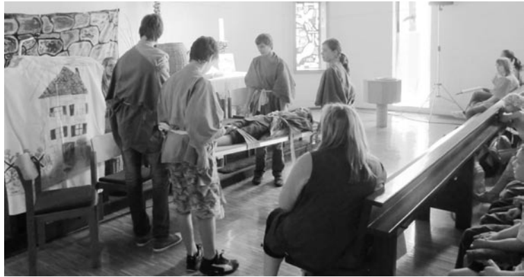
Kirche in Allmersbach - Anspiel von der Heilung des Gelähmten

Der Kindertag startete am 07.05.2011 um 9.30 Uhr in der Kirche in Allmersbach. Die Kinder aus Kleinaspach durften mit dem Sonnenhofzüge zum Kindertag fahren. Mit einigen Liedern haben wir den Tag begonnen. Eine Anspielgruppe führte die Geschichte von der Heilung des Gelähmten auf.