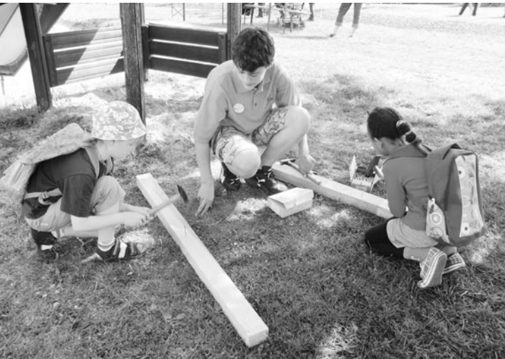
Nagelprobe mit Frauenpower

Damit die Kinder sich für das Nachmittagsprogramm stärken konnten, gab es leckere Saitenwürstle, Weckle, Äpfel, Karotten, Gurken und Kuchen.