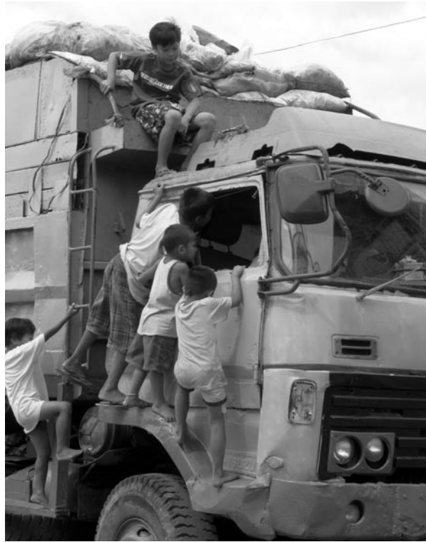
Boa, der hat ja Kopfstützen...! In Wahrheit geht es darum, die besten Müllreste zu ergattern ...

schen dort in nahezu unerreichbarer Ferne. Aber wir können schon durch Kleinigkeiten mithelfen, die Lebenssituation der Straßenkinder zu verbessern: Wer gebrauchte Sommerkleider, Schuhe, Haushaltsartikel oder Spielsachen spenden