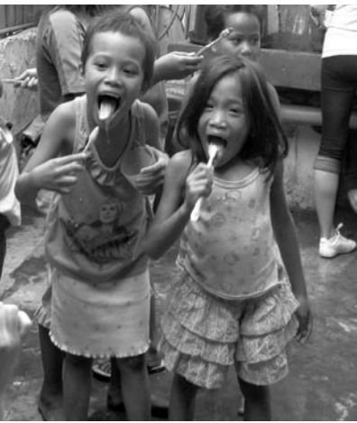
Maß? Üben im Drop In Center.

in eine Art Mutterrolle geschlüpft bin. Am meisten berührt hat mich jedoch das Leben vieler Straßenkinder in den Slums. Kinder arbeiten dort schon von klein auf täglich stundenlang auf einer Mülldeponie, damit sie und ihre Familien überleben können. Durch das Drop In Center, das am Rande eines Slumgebiets steht, wird den Menschen sowohl psychisch als auch physisch geholfen: Sie können dort duschen, bekommen